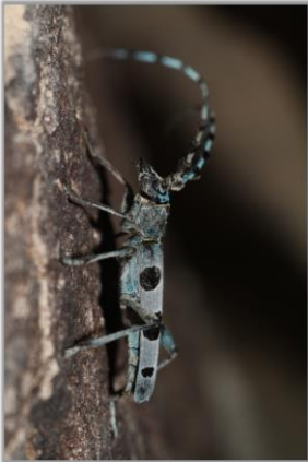
Pic noir - J. Bisetti / Rosalie des Alpes. J. Hahn