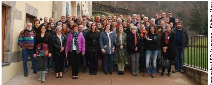
Séminaire LPO Auvergne - Rhône-Alpes

notre rôle dans la société régionale Auvergne-Rhône-Alpes. Cela va, depuis les modes de fonctionnement interne dans chaque association (exemple de la réflexion qui a été menée en Savoie avec le dispositif d'accompagnement "DLA" sur notre projet associatif et notre mode de gouvernance), jusqu'à l'unification de notre stature régionale, en passant par l'harmonisation de nos fonctionnements, par la voie du partage des compétences et de la refonte de notre projet associatif commun. Ce projet devrait aboutir, du point de vue administratif, à une "fusion" de toutes les associations locales - y compris la LPO Savoie - en une seule grande association LPO à l'échelle Auvergne-Rhône-Alpes , qui comporterait autant de délégations locales que d'actuelles associations locales. Ce projet vise à conserver la liberté de décider et d'agir localement, tout en faisant force de proposition dans les politiques régionales. A cet effet, 3 séminaires ont déjà eu lieu, sans compter les réunions des commissions de travail, avec la participation de membres actifs volontaires de toutes les associations. Un quatrième séminaire est prévu en septembre prochain avant d'entériner ce processus de "fusion régionale" devant les assemblées générales extraordinaires de chaque LPO à la fin de l'année 2018.